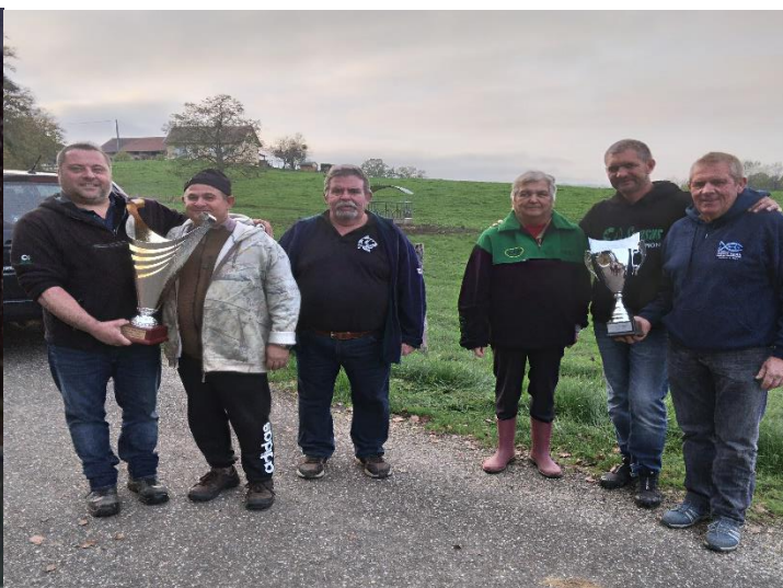
Les vainqueurs 2022

REPAS POT AU FEU POUR LES NON PECHEURS A PARTIR DE 12 HEURES AU LOCAL ECOLE DE PECHE